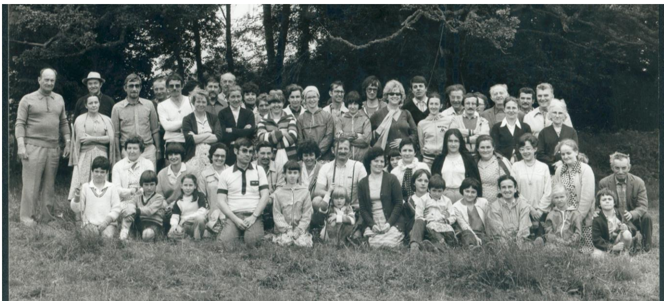
Photo prise lors d'une bouade