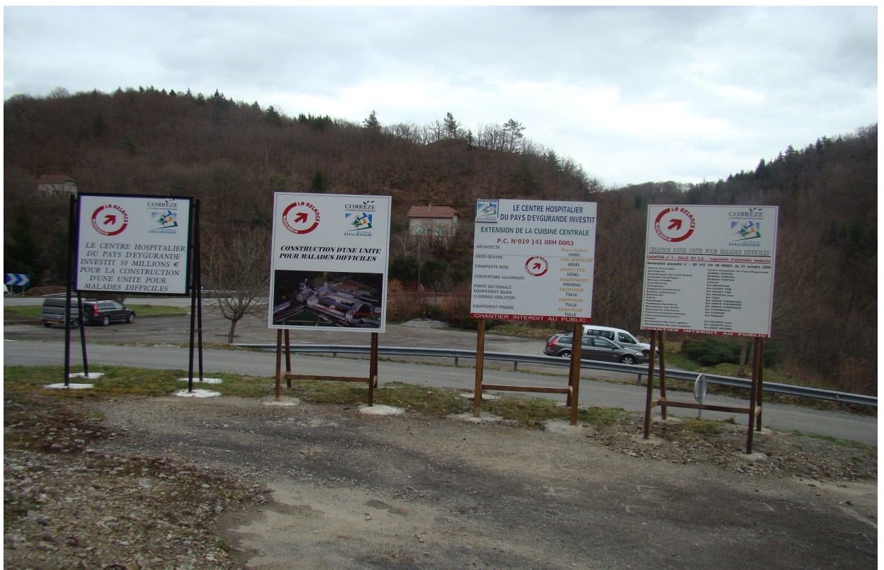
Les Panneaux du CHPE au débouché de la RD 1089 avec la RD 184