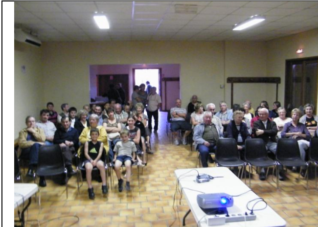
ASSISTANCE TRES ATTENTIVE