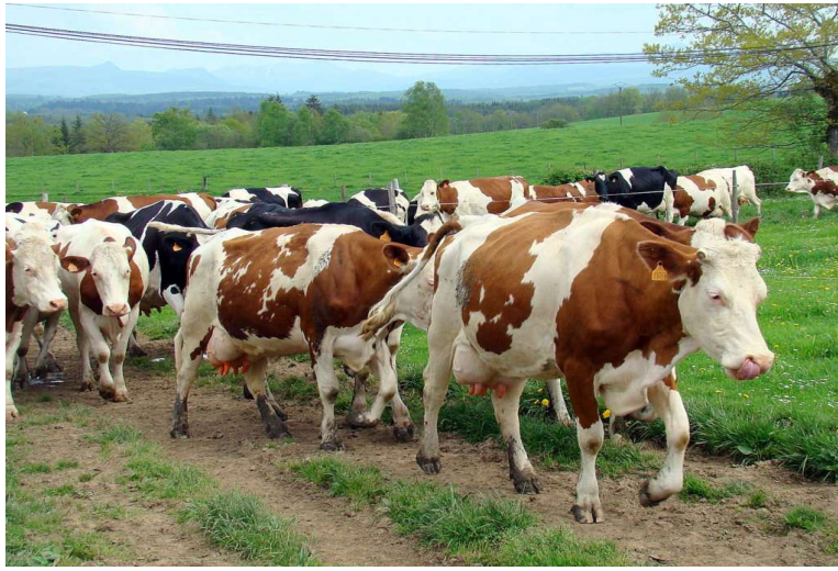
Les vaches de la ferme des Sully