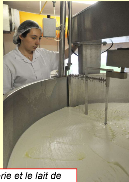
La fromagerie et le lait de moyenne montagne fourni par le troupeau ci-dessous