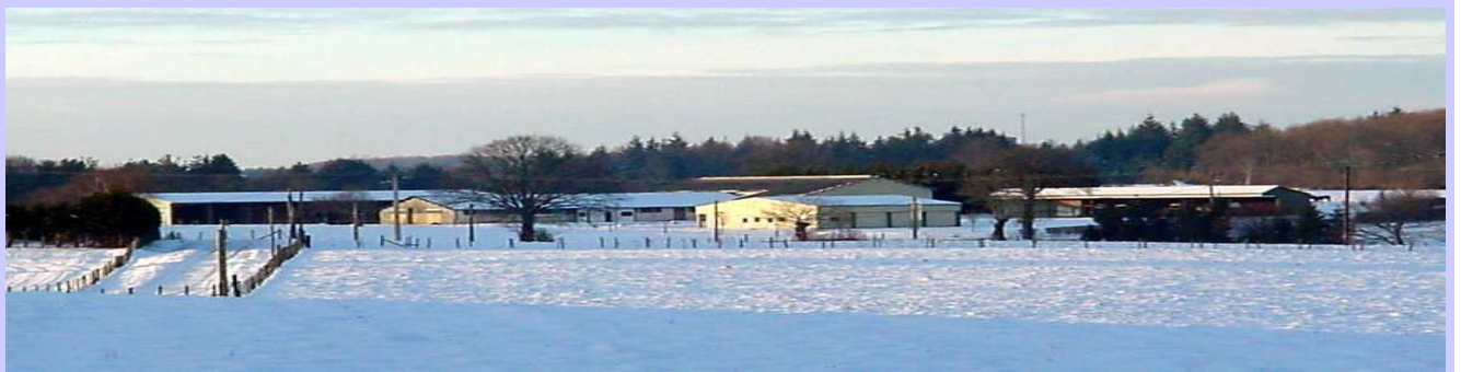
ensemble ferme fromagerie de l'aire des Sully (Fromages fermiers de montagne)