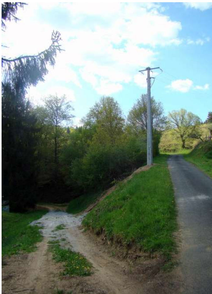
Un nouveau poteau suivi d'un réseau souterrain (vers le château d'eau du CHPE La Cellette)