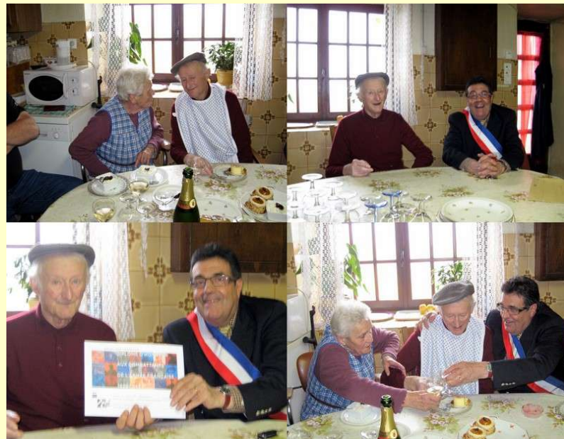
Le 12 mai On trinque à trois avec champagne et gâteaux : Un tel diplôme et un anniversaire, cela s'arrose (A.O)