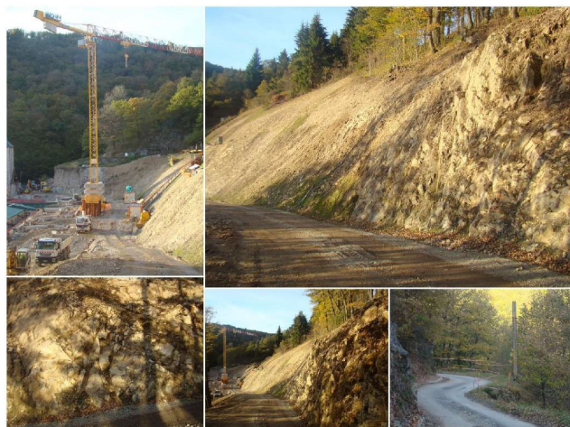
Une vue générale de l'importance des chantiers