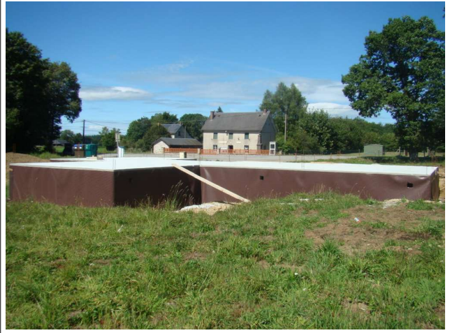
La dalle est réalisée