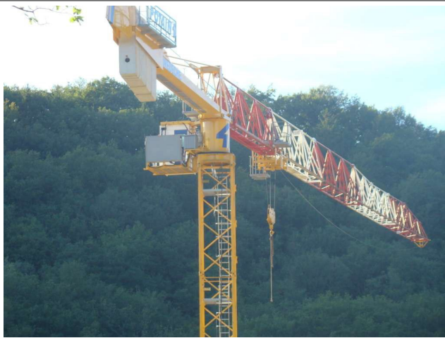
Entreprise Bredèche 19200 Ussel