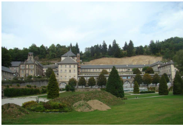
La colline est particulièrement rognée