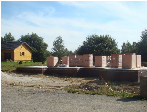
Entreprise KESKIN Ussel