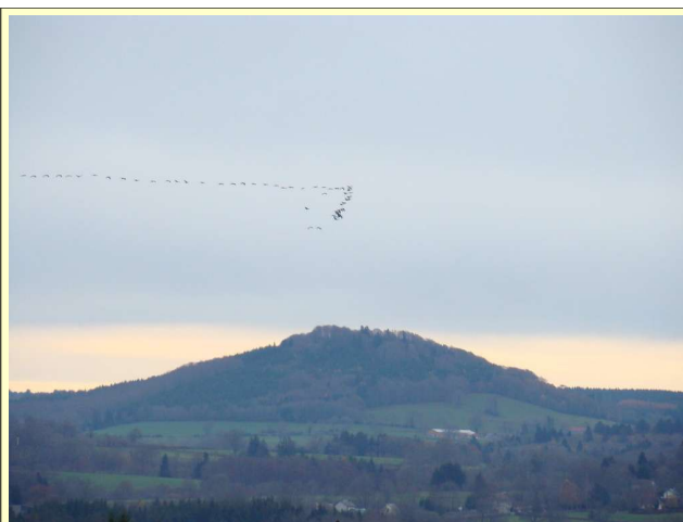
Vers le préchonnet