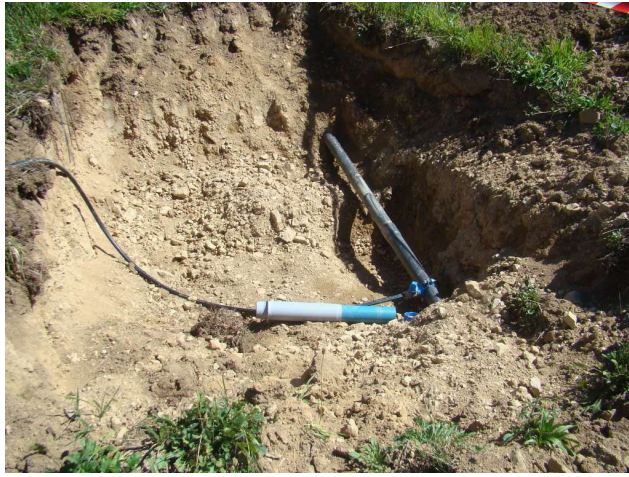
Raccordement provisoire en eau