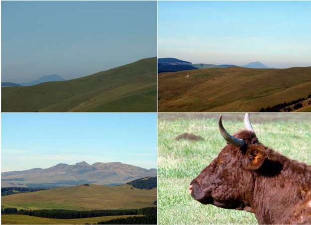
Le Sancy, des vaches des lacs. Un beau paysage