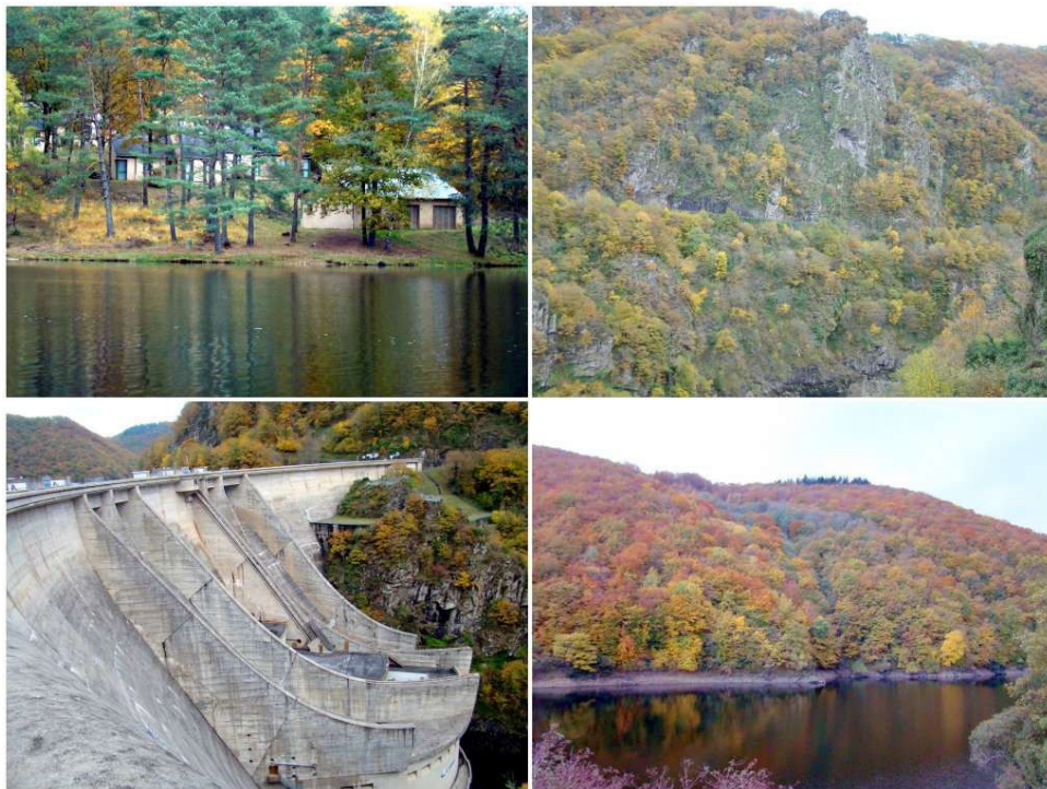
Plan eau de Soursac, Barrage de l'Aigle. Vers le pont de Saint-Projet 01/11/2010