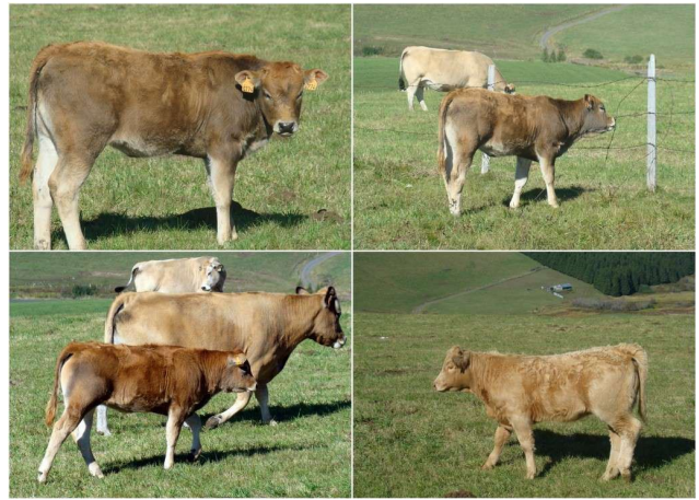
Des veaux de toutes les races