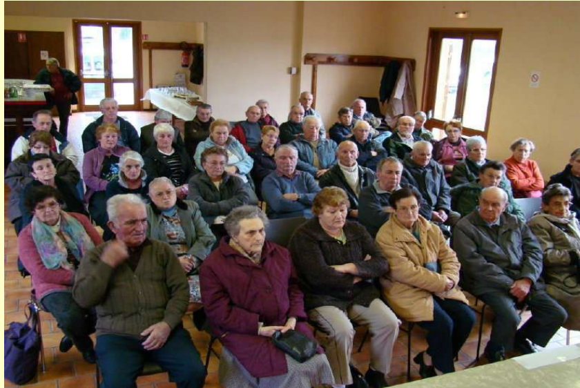
Une vue de l'assistance. AG de l'amicale des retraités de La Cellette. 15 nov 2010

• Attention ! Un arrêté conjoint des conseils généraux du Puy de Dôme et de la Corrèze précise que la RD 1089 (19) et RD 2089 (63) EX RN 89 seront fermées entre le 15 et le 19 novembre pour faciliter la réfection du tablier du pont du Chavanon (c'est le cg 63 qui est maître d'ouvrage)