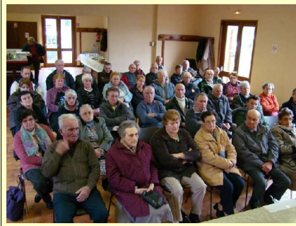
Voir plus bas