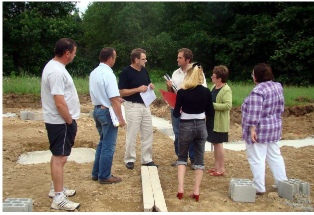
Les fondations sont coulées