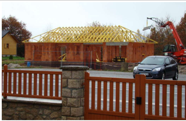
La couverture pointe son nez (9 nov 2010) Entreprise Gouny Ussel