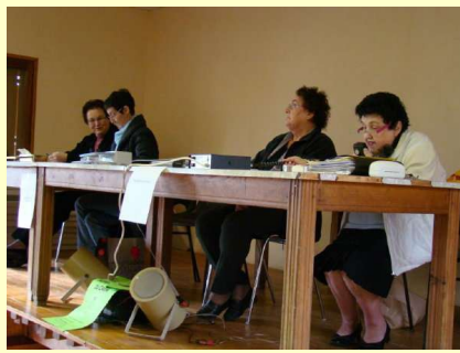
Le bureau de l'Amicale