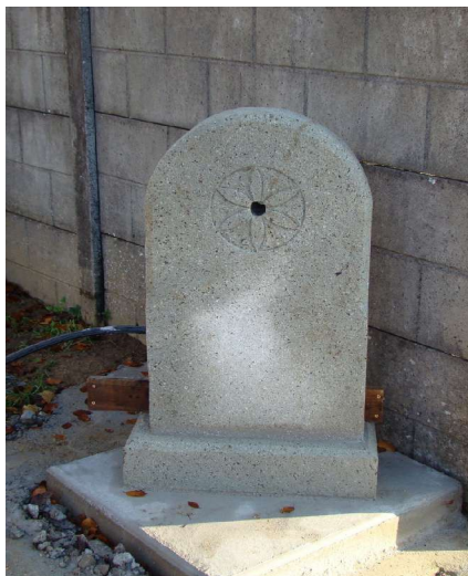
Un cimetière assaini (Merci à tous)

• 3 novembre : Mise en place de la fontaine au nouveau cimetière. Merci à Sylvain Ollier et à ses amis (il manque le robinet)