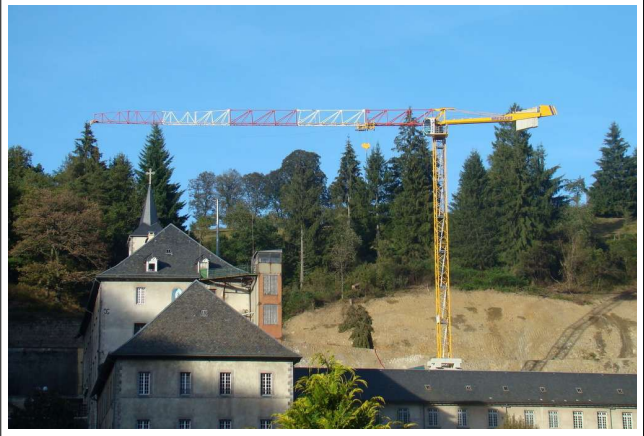
Une grue s'impose dans l'environnement