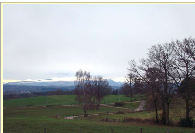
17/11/2010 les Grues cendrées passent à la Vervialle