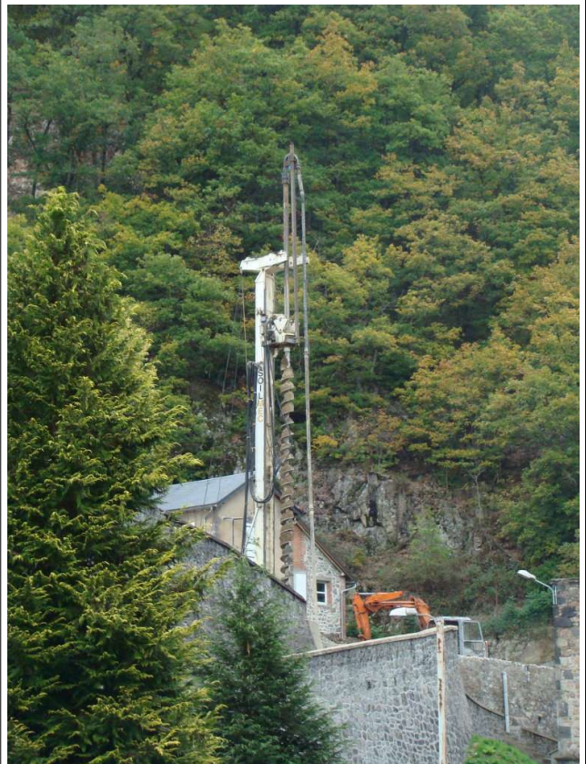
La Foreuse est aussi imposante