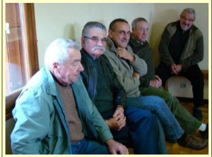
Les places sont chères