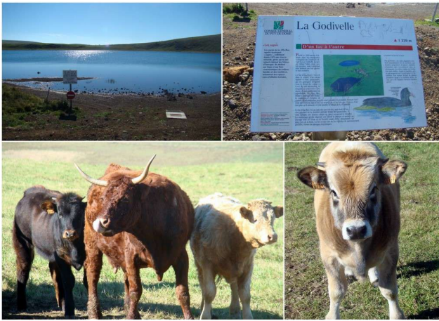
Une balade dans le massif du Cézallier: La Godivelle (63) vers Egliseneuve d'Entraygues