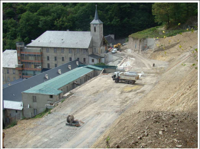
Des travaux importants