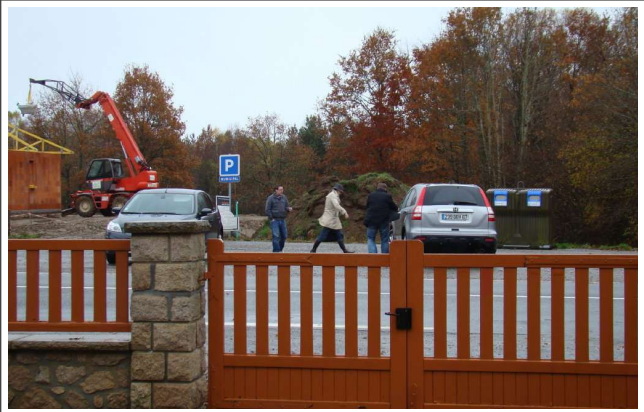
Les architectes(3) affrontent les premiers frimas