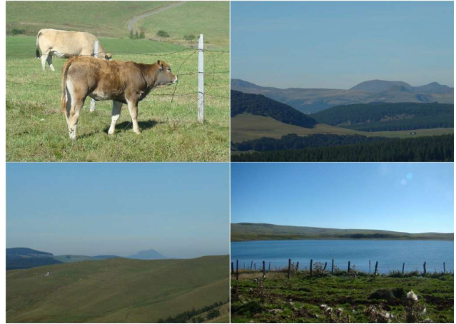
Le Puy de Dôme au fond