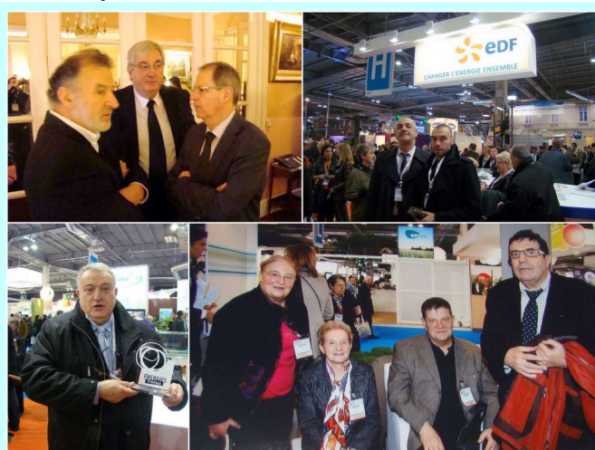
Salon des Maires (porte de Versailles)