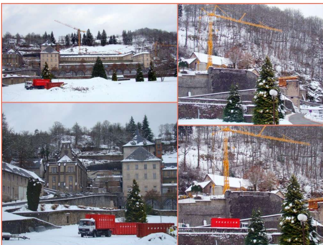
Une vue d'ensemble des nombreux travaux