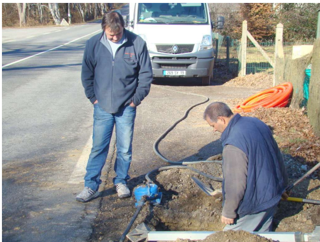
L'entreprise CARRETO tente un fonçage en vain