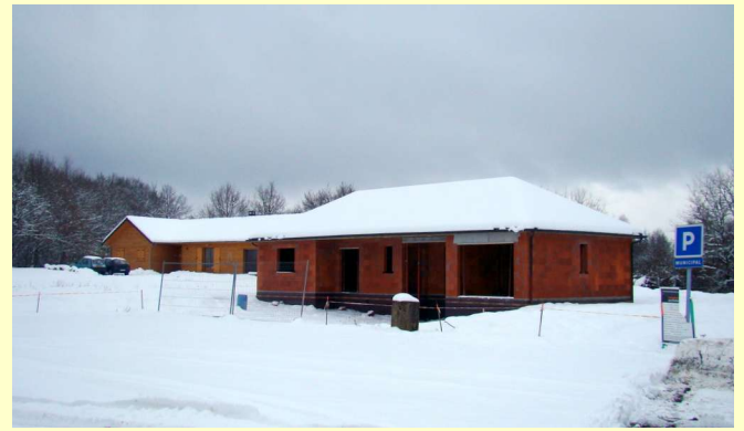
Les fenêtres et les portes arrivent 20/12/2010