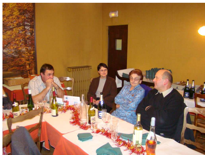
Meilleurs voeux 2011 à toutes et à tous