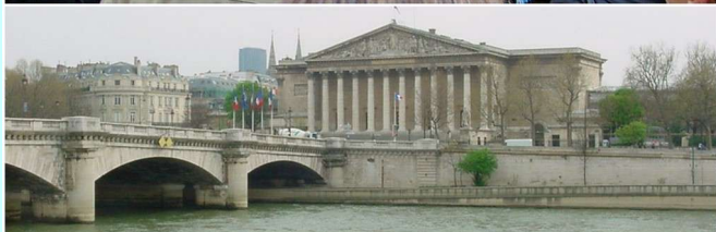
Assemblée nationale avec notre député J.P Dupont