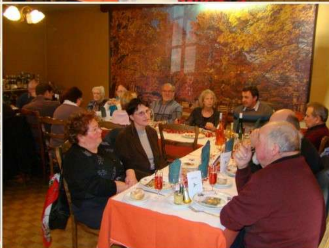
Repas des seniors au restaurant l'Oasis de Mme et M. Chiroux (43 convives)