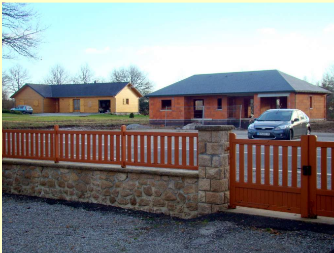
La neige a fondu 10/12/2010