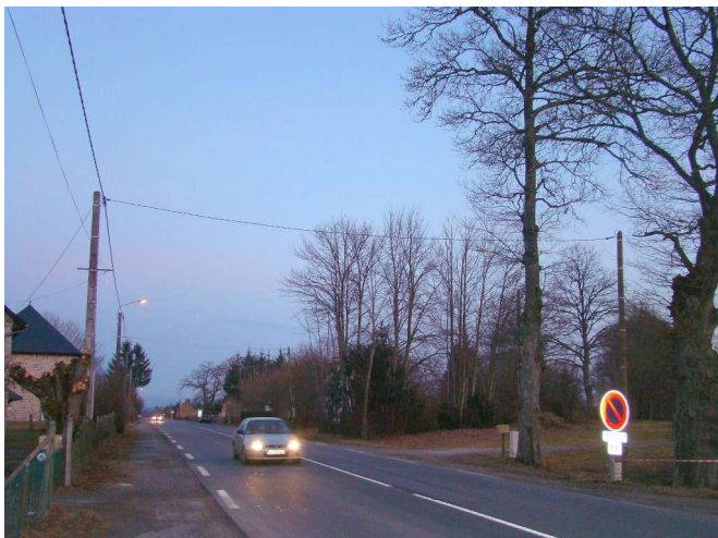
Finalemnt alimentation en aérien (fèv 2011)