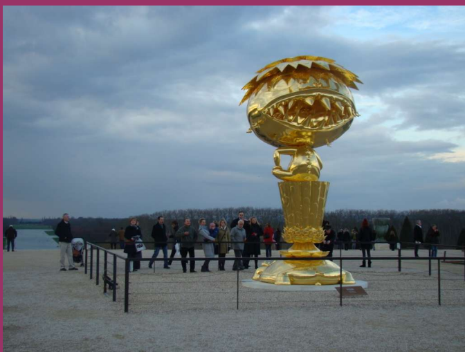
Versailles (Yvelines 78)