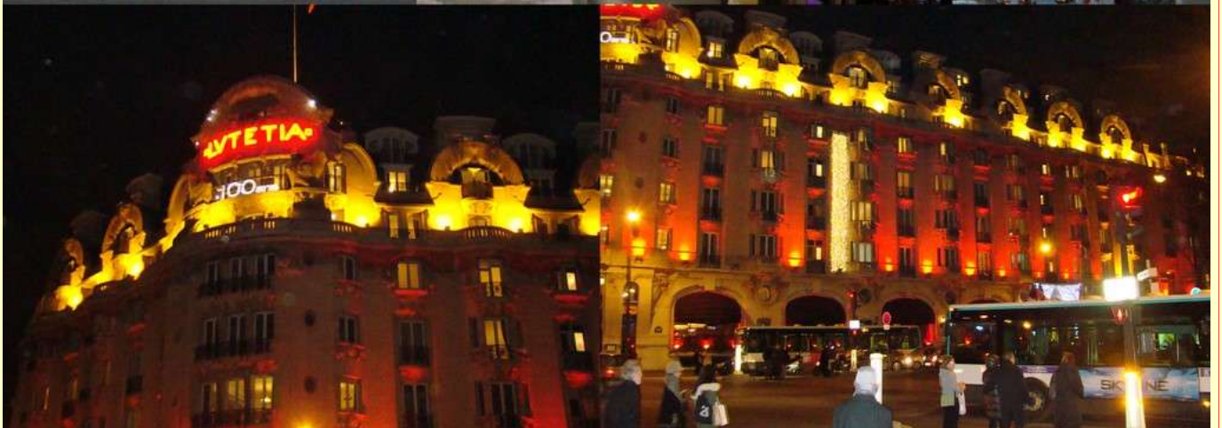
La Lumière de notre Capitale : PARIS (15/Dec/2010)