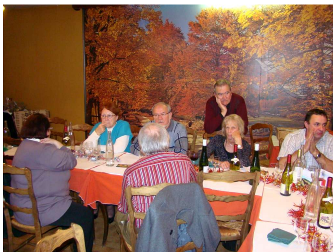
On est finalement bien ici !