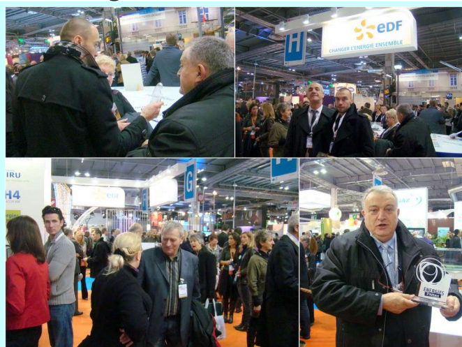
Salon des Maires