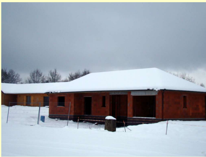
La mairie est couverte (ouf ! Il était temps)