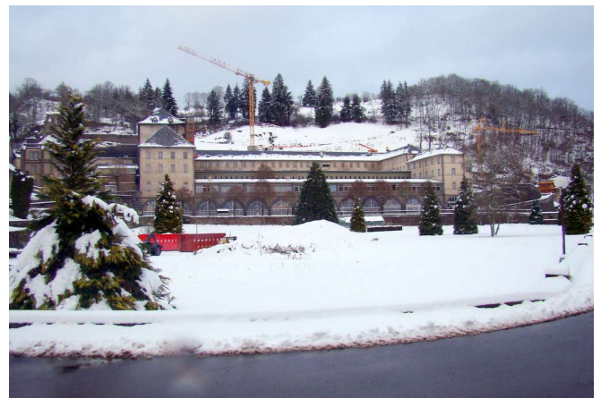
Deux imposantes grues s'élèvent au CHPE