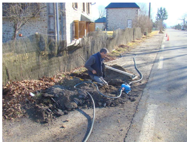
sous la RD 1089 pour l'alimentation en électricité