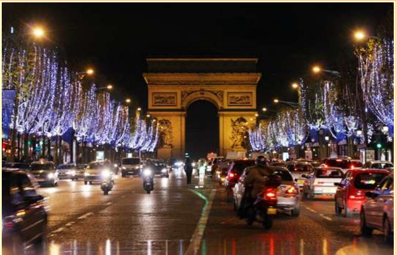
Les Champs Élysées à Paris