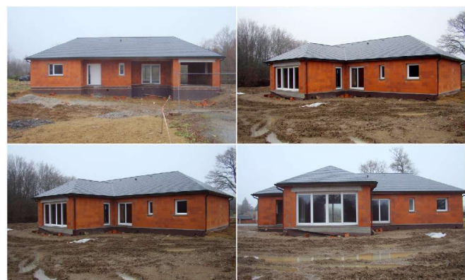
Portes et fenêtres (janv 2011)