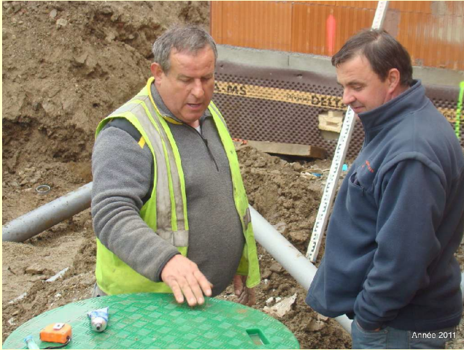
Notre ami claude avec un responsable(RMCL)