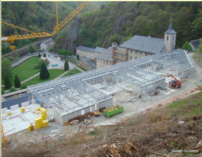
Travaux réalisés dans le cadre du plan de relance : Subvention gouvernementale de 13,5 M €