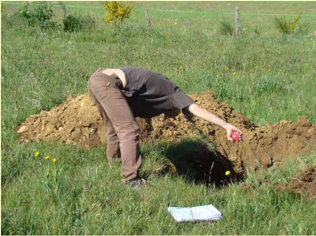
On mesure. c'est sérieux !