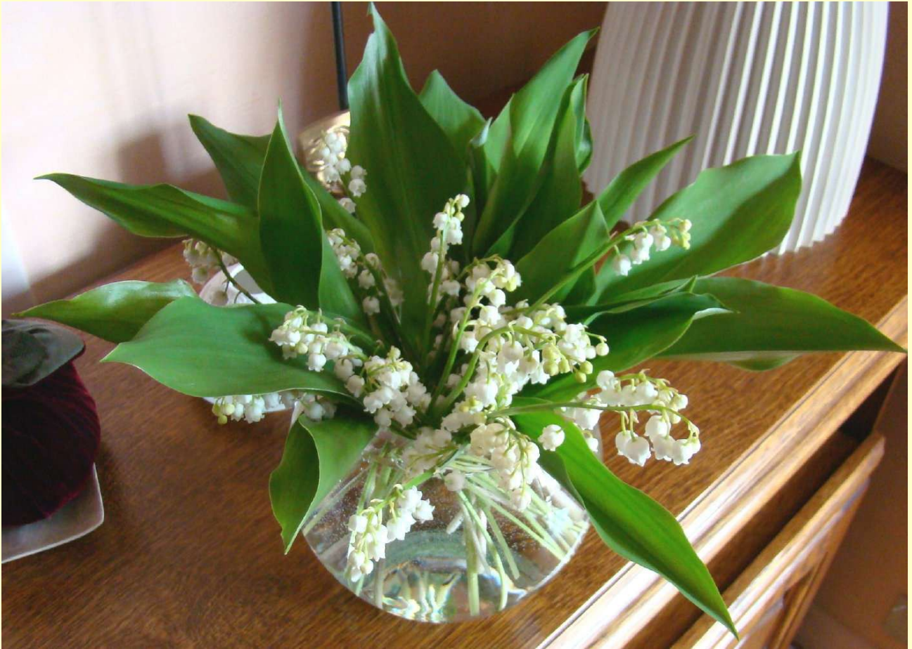
Un brin de muguet symbole de porte-bonheur pour le 1er mai