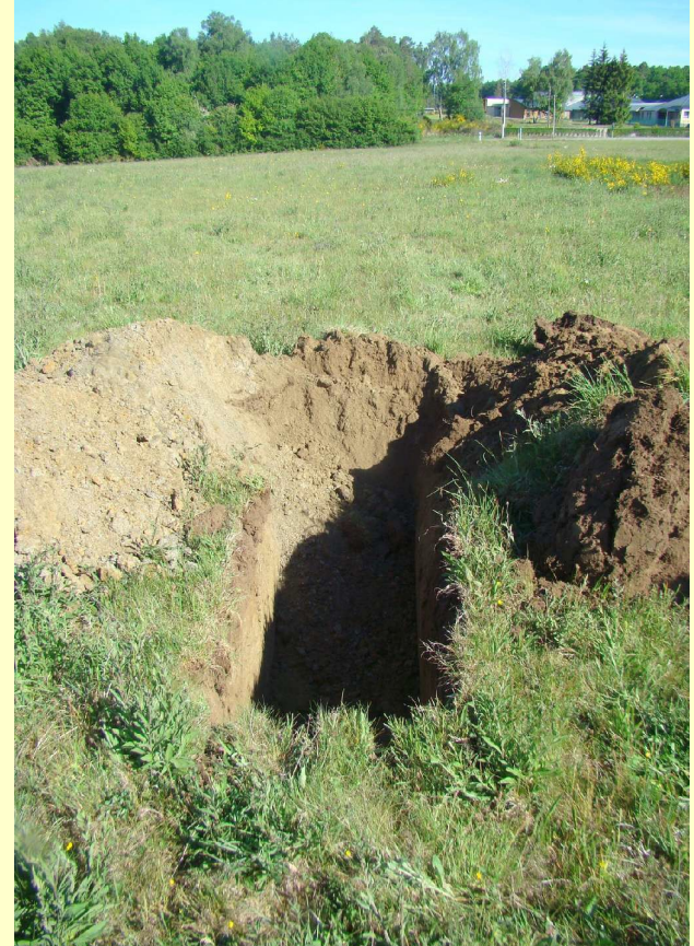
Des trous dans le sol pour analyser sa nature