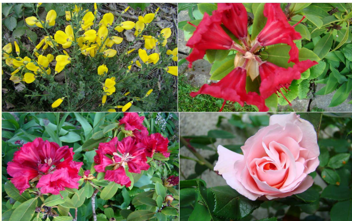
Des fleurs de mai

Les élections législatives se dérouleront les 10 et 17 juin 2012