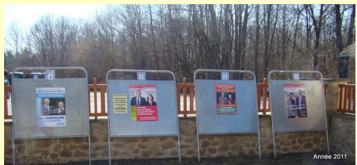
Panneaux électoraux numérotés de 1 à 4 en partant de la droite