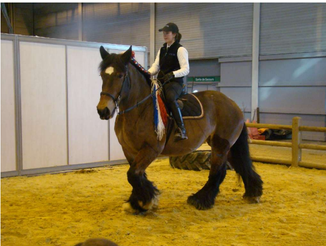
Un cheval du Nord