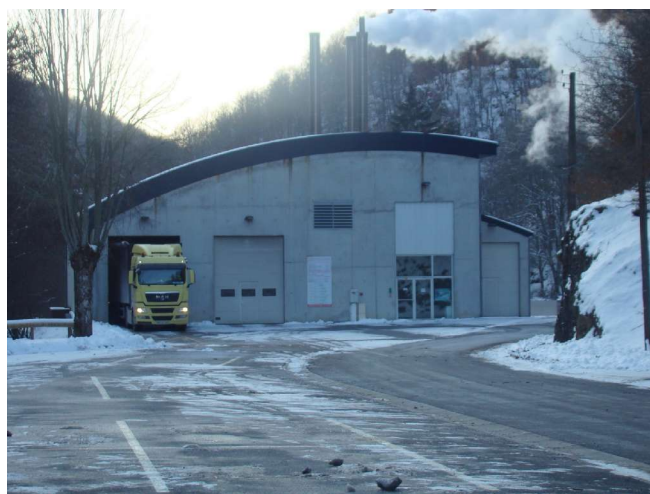
La chaufferie bois du CHPE est souvent alimentée

6.) Ouverture des nouveaux locaux (neufs) du CHPE où ont été transférés les services des « bleuets » et des « chardonnerets »