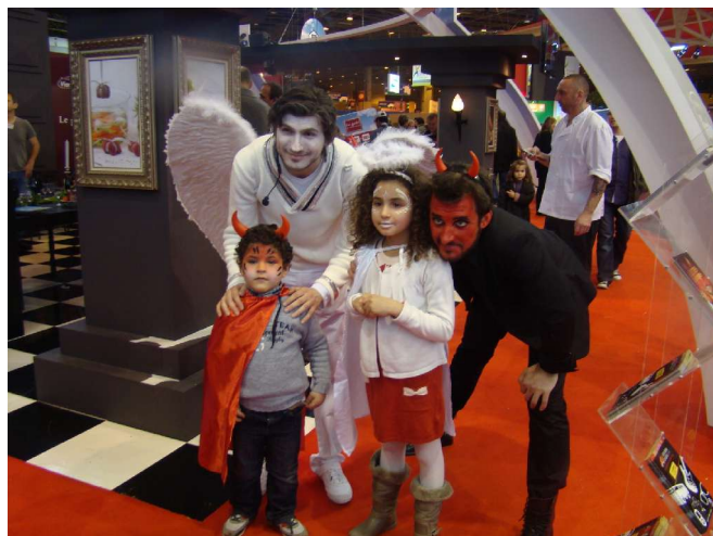
Publicité pour la viande de boeuf (comme à la télé)