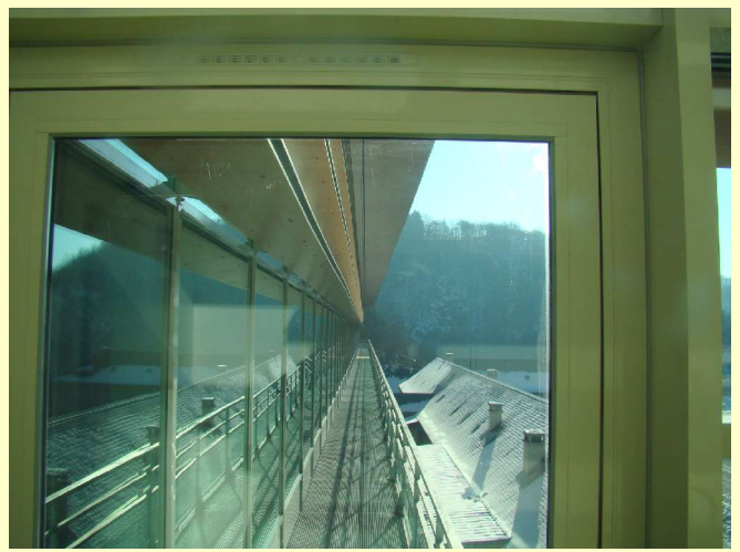
Une prouesse architecturale ( Architecte : André Jalicon)