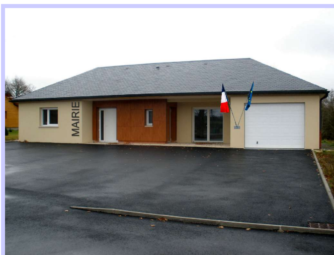
Le visage futur de la nouvelle Mairie.