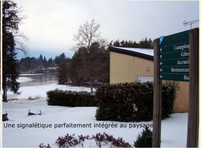
Une signalétique parfaitement intégrée au paysage

32 gîtes sur 70 se trouvent à l'Abeille, sur le territoire de la commune Le plan d'eau (13ha se trouve en partie sur la commune de Monestier-Merlines (digue))