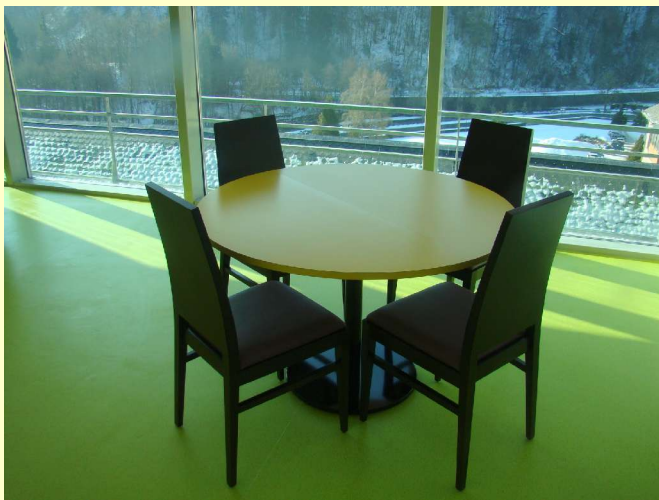
De grandes baies vitrées et une magnifique vue sur le Puy de Dôme