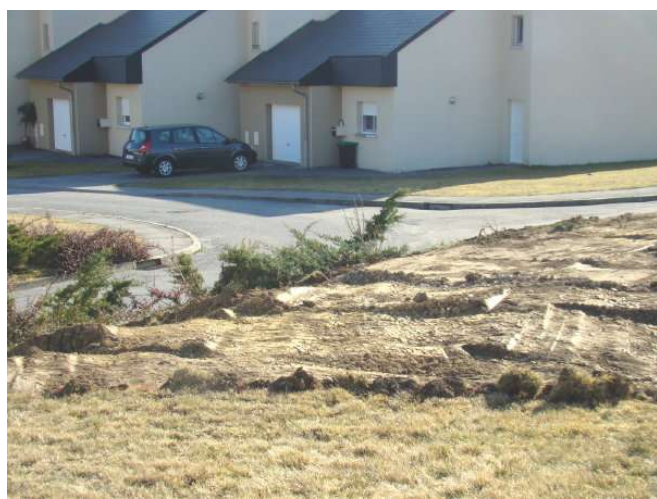
À proximité des pavillons de gendarmerie A89

19 mars : Cinquantième anniversaire du cessez-le-feu en ALGERIE (1962. Accords d'Evian). C'est aussi cette année, l'arrivée à Monestier-Merlines, de 20 salariés, de la maroquinerie de Bort Les Orgues travaillant désormais à l'intérieur de l'ex-usine XL-literie (environ 700m 2 ) propriété de la com-com.