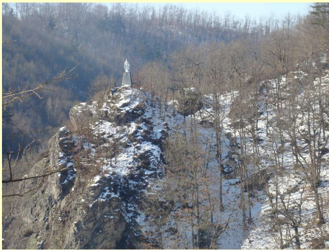
Le CHPE est toujours sous la bénédiction de la Vierge (1952)