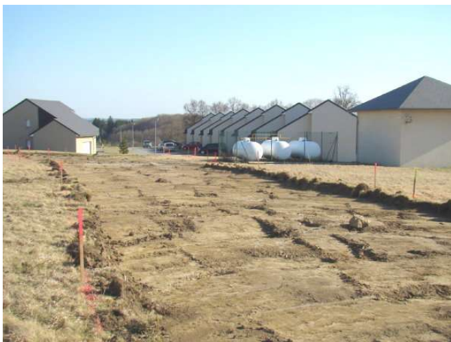
Zone d'habitation du vieux chêne (8 lots)