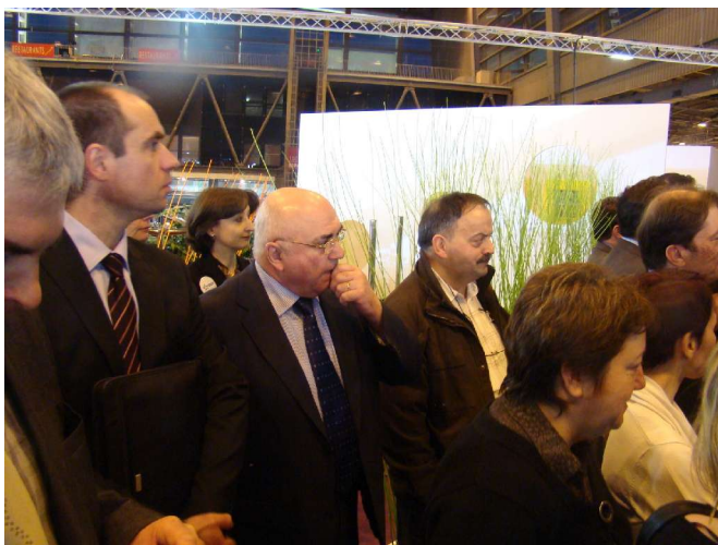
Ici, les responsables de la fromagerie des Sully pour défendre leurs productions. Nous leur disons MERCI pour les deux médailles obtenues : argent pour le « Saint Laurent » et bronze pour la « tome Limousine ». Félicitations à tous les acteurs de cette fromagerie de la Fondation Jacques Chirac qui fait honneur à notre Commune