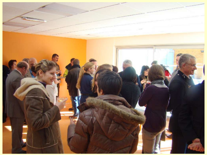
Inauguration des locaux neufs du CHPE ( Ven 10/02/2012)

Une assistante maternelle agrée chez Ribes de Monestier-Merlines (4 enfants accueillis simultanément : trois (3) de 0 à 18 ans et un (1) de 2 à 18 ans)