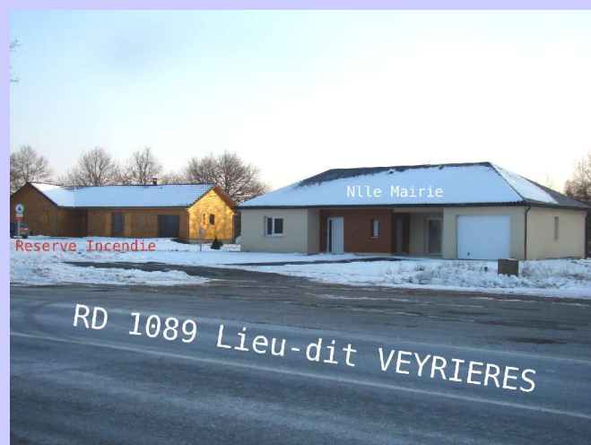
Facilement convertible en maison d'habitation

La future zone d'habitation du Vieux Chêne (8 lots). Montant des travaux supérieur à 90000€