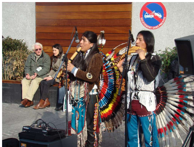
Animation à l'extérieur proche du salon