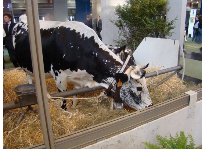
Une vosgienne ????