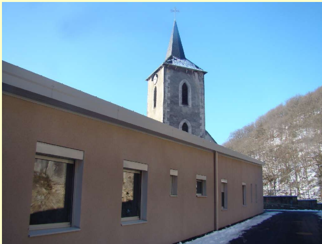
Le nouveau service des admissions