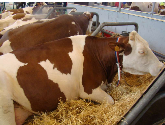
Des montbeliardiennes (Troisième race de vache à lait)