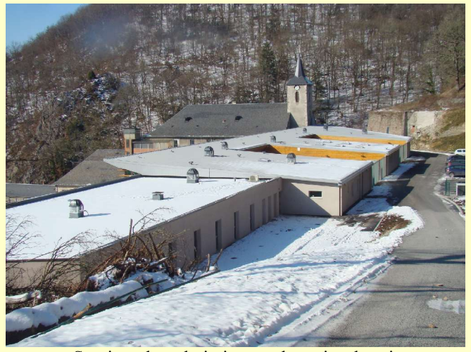
Services des admissions et des soins de suite