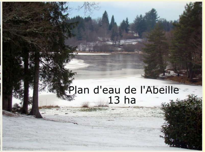
Plan d'eau de l'Abeille 13 ha