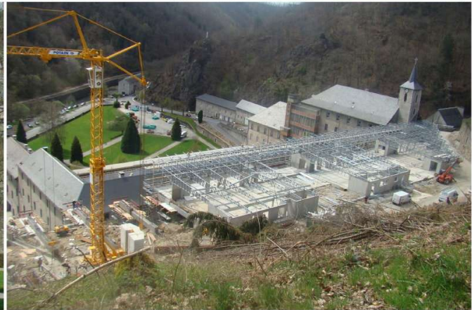
La Cellette change de visage avec la création de l'UMD (Unité pour Malades Difficiles)