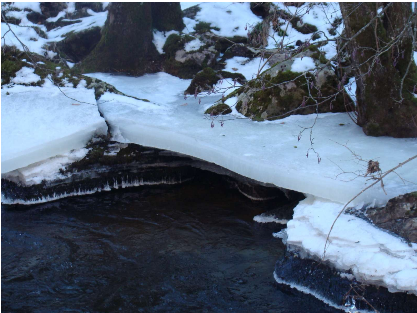
On peut apprécier l'épaisseur de la glace