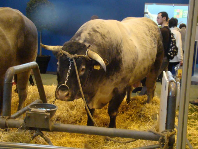
Un taureau bazadais (Bazas 33)

7.) Quelques photos du salon de l'agriculture à Paris du 25/02 au 04/03/2012. Porte de Versailles, parc des expositions