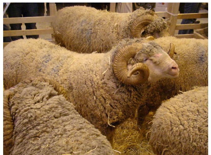
Des beliers avec de belles cornes