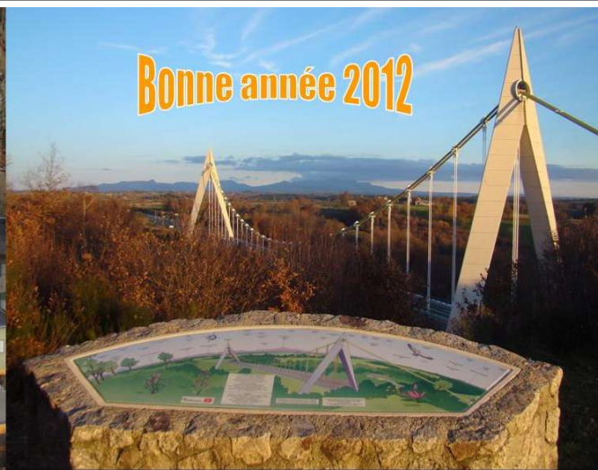
Recto : Le nouveau visage du CHPE et le viaduc du Chavanon (sur l'A89 à cheval sur le Chavanon)