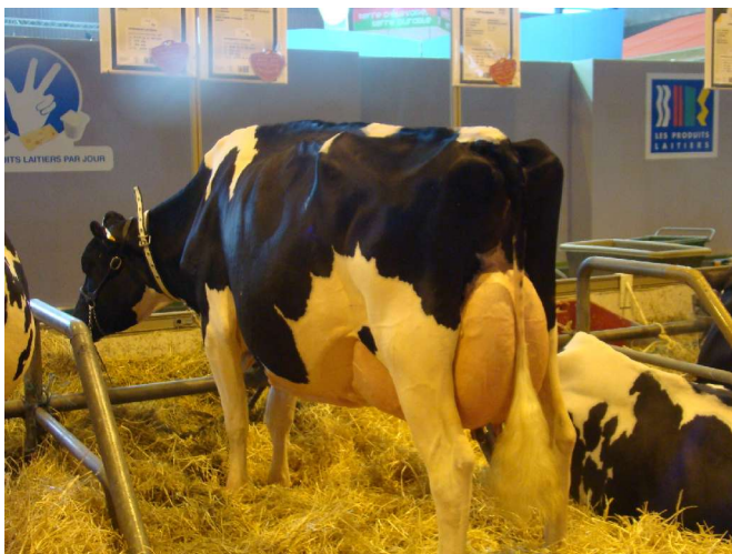
La première race de vache à lait : La prim-holstein