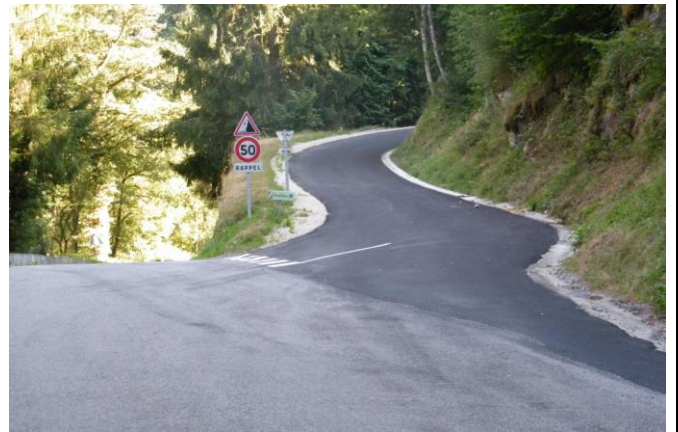
Fin des travaux CR3 avec marquage au sol Travaux CHPE route VC3