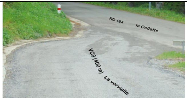
1 ère tranche de travaux